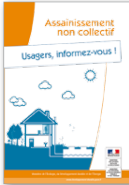
Assainissement non collectif Usagers, informez-vous ! 6 pages - octobre 2013