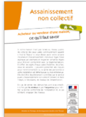
Assainissement non collectif Acheteurs ou vendeurs d'une maison, ce qu'il faut savoir 4 pages - octobre 2013