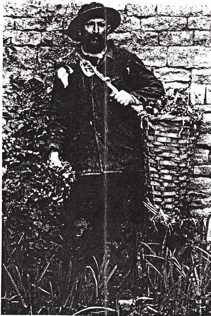
Une figure du Graye d'autrefois, carte postale extraite de l'ouvrage "La France paysanne" et souvent présentée à la télévision dans l'émission "questions pour un champion".

Quelqu'un peut-il aider à l'identifier ?