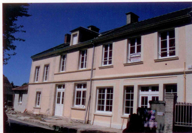
Les travaux en cours fin juillet

Le nouvel accès au secrétariat de mairie par l'ouest a imposé la construction d'un portail neuf plus au nord pour sécuriser la cour de l'école.