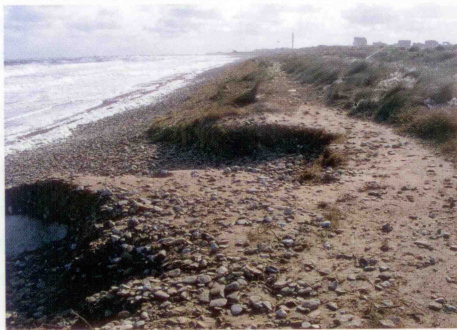
Erosion littorale en 2003

Le littoral de Graye souffre depuis de longues années de l'érosion marine et le trait de côte est très fragile. Depuis le début des années 1990, le trait de côte a reculé de près de 20 mètres entre la brèche de la Valette et Ver sur mer. Au cours des seules tempêtes de février et avril 2002 le recul a été de 7 mètres.