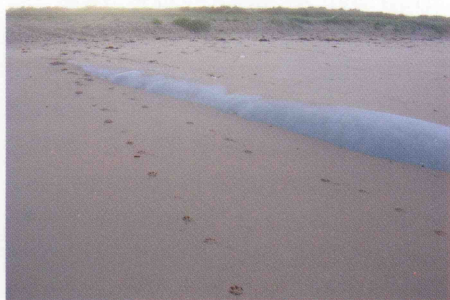
Plage de sable reconstituée grâce à l'ouvrage à l'ouest de la Valette

plage. Il est maintenant quasiment recouvert de sable ce qui prouve son efficacité. Le second ouvrage de 97 mètres a été implanté à 160 mètres du précédent, 45 mètres à l'Ouest de la cale de la Valette, pour capter le sable le plus éloigné du trait de côte. Moins de deux ans après leur installation ces deux ouvrages sont très fonctionnels et une plage de sable agréable s'étend devant le camping qui ne craint plus l'érosion. Plus à l'ouest vers Vaux, les plantes dunaires commencent à recoloniser l'avant dune signe d'une stabilisation de ce secteur.