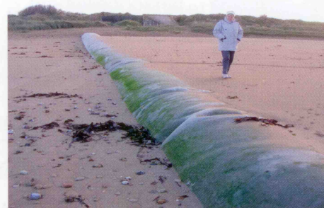
Le profil de la plage bien engraisé à l'ouest de l'ouvrage implanté à la brèche de Graye

Progressivement le sable s'accumule et ce volume progresse et s'étend vers le haut de plage. Le profil de plage s'engraisse et se trouve relevé. Le sable ainsi accumulé permet de réduire l'effet des tempêtes futures puisque les houles remontent moins haut sur l'estran et leur énergie est réduite.