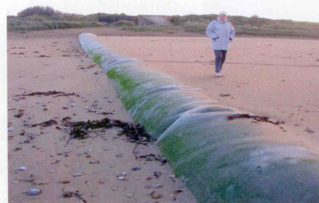
Le profil de la plage bien engraisé à l'ouest de l'ouvrage implanté à la brèche de Graye

Progressivement le sable s'accumule et ce volume progresse et s'étend vers le haut de plage. Le profil de plage s'engraisse et se trouve relevé. Le sable ainsi accumulé permet de réduire l'effet des tempêtes futures puisque les houles remontent moins haut sur l'estran et leur énergie est réduite.