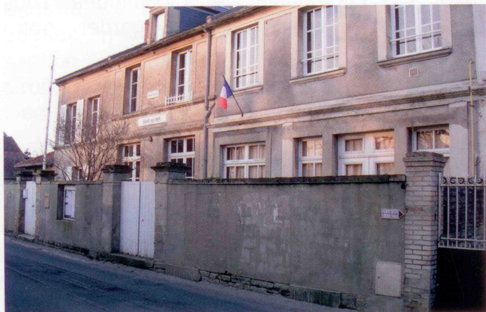
Avant le début des travaux

Après appel à la concurrence, l'entreprise Marie a été sélectionnée pour réaliser les autres phases de rénovation et d'aménagement.