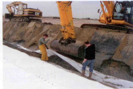
Ancrage du géocomposite dans une tranchée

menée par des scientifiques sollicités par la commune, le choix s'est porté sur le dispositif Stabiplage qui capte, accumule et maintient en place le sable transporté par les vagues. Le Stabiplage est une structure ancrée en géocomposite qui est injectée de sable lors de sa mise en place ce qui lui donne sa forme cylindrique de « boudin ».