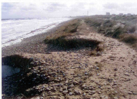
Erosion littorale en 2003

Le littoral de Graye souffre depuis de longues années de l'érosion marine et le trait de côte est très fragile. Depuis le début des années 1990, le trait de côte a reculé de près de 20 mètres entre la brèche de la Valette et Ver sur mer. Au cours des seules tempêtes de février et avril 2002 le recul a été de 7 mètres.