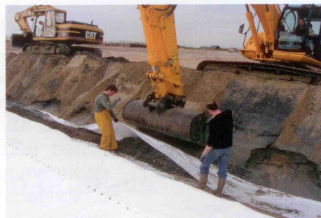
Ancrage du géocomposite dans une tranchée

menée par des scientifiques sollicités par la commune, le choix s'est porté sur le dispositif Stabiplate qui capte, accumule et maintient en place le sable transporté par les vagues. Le Stabiplate est une structure ancrée en géocomposite qui est injectée de sable lors de sa mise en place ce qui lui donne sa forme cylindrique de « boudin ».